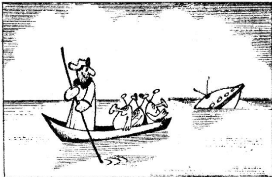
Рис. В. Сушенцова.